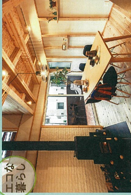
暖をとり煮炊きすることが出来る薪ペレットストーブを設置