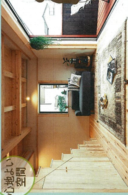
床には無垢の杉、壁には調湿性のあるモイス。自然素材で快適な空間に