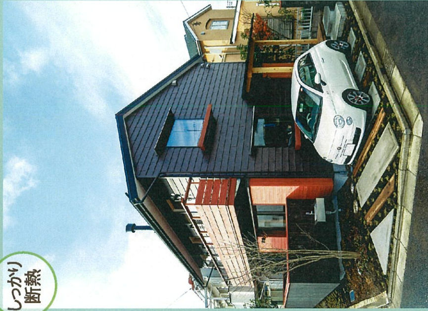
外壁にはスタイリッシュで耐久性が高いガルバリウム平葺を採用