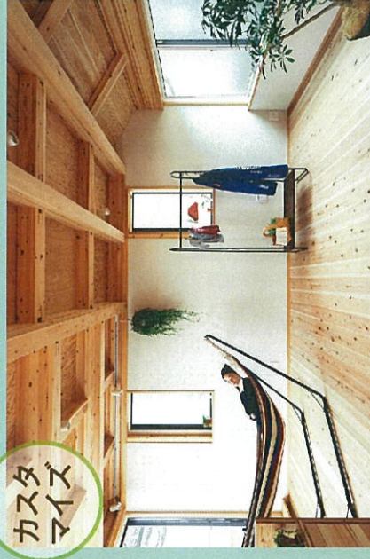
家族が増えたら間仕切って。可変性のあるオープンルーム