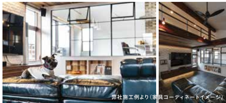
弊社施工例より(家具コーディネートイメージ)

某人気インテリアショップの家具でリビング・ ダイニングをコーディネートしています。(家具付住宅) 暮らしのイメージを広げてみてくださいね。